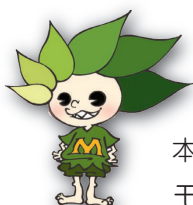
本校のマスコットキャラクター モリ ミドリ

「杜(もり)」は大木が茂る神聖な場所や神社の森、そして木がこんもりと茂っている所を意味しています。本校が過去から未来に向けて繁栄し続けるように、また校地にある木々のように大地にしっかりと根を張り大きく成長して明るい未来を切り開いてほしいと願っています。