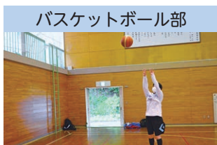
バスケットボール部

絵画、イラスト、デッサン、写真など幅広く活動しています。希望者は各種コンクールやいわき市民美術展覧会などに出品しています。