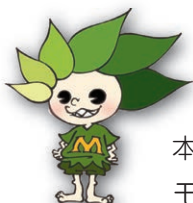
本校のマスコットキャラクター モリ ミドリ

「杜(もり)」は大木が茂る神聖な場所や神社の森、そして木がこんもりと茂っている所を意味しています。本校が過去から未来に向けて繁栄し続けるように、また校地にある木々のように大地にしっかりと根を張り大きく成長して明るい未来を切り拓いてほしいと願っています。