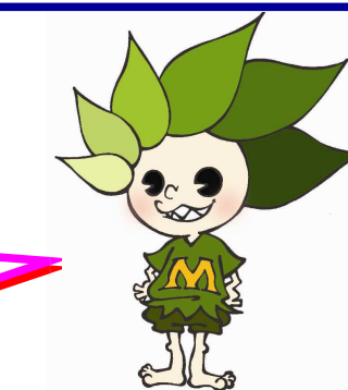
本校マスコット キャラクター モリミドリ