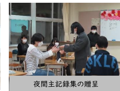
夜間主記録集の贈呈