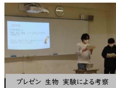
プレゼン 生物 実験による考察