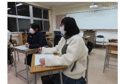
好きなことを語ろう