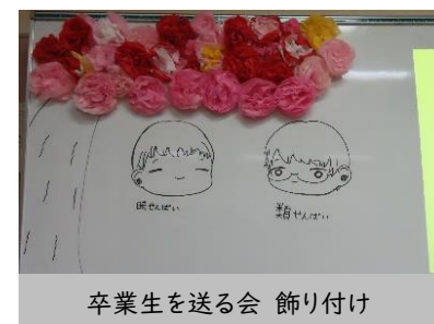
卒業生を送る会 飾り付け