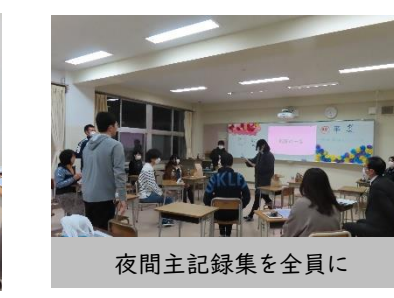
夜間主記録集を全員に