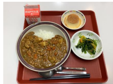
本日のメニュー 美味しいカレー