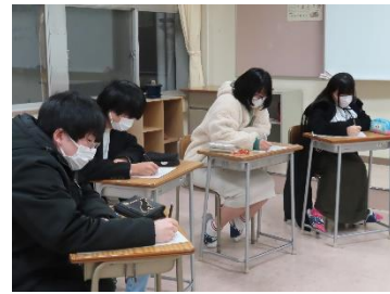
熱心にメモを取る在校生