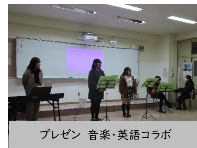
プレゼン 音楽・英語コラボ