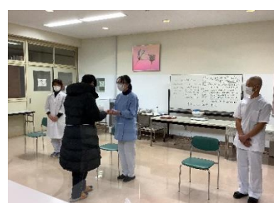
卒業生より色紙贈呈