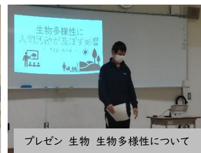
プレゼン 生物 生物多様性について